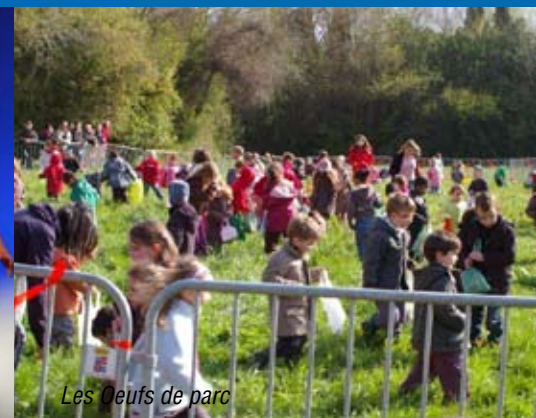
Les Oeufs de parc