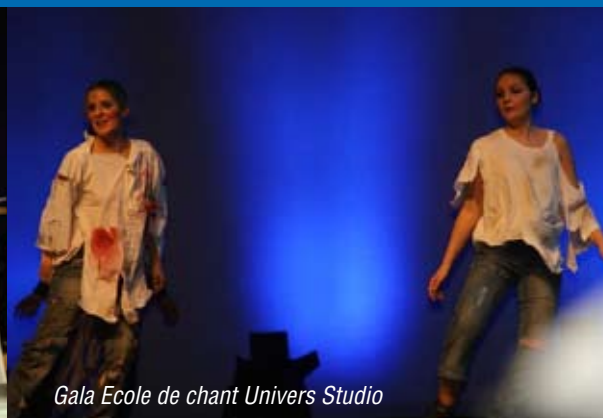
Gala Ecole de chant Univers Studio