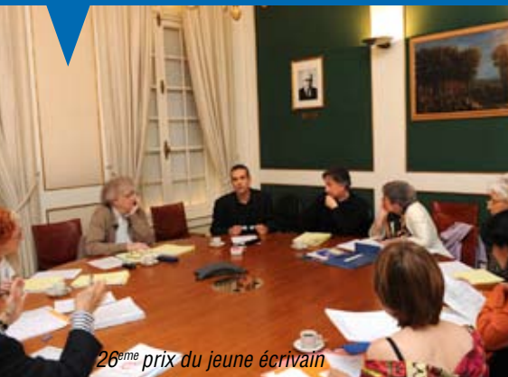
26 ème prix du jeune écrivain