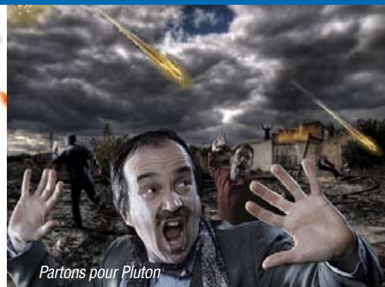
Partons pour Pluton