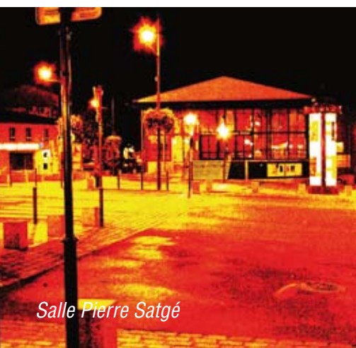
Salle Pierre Satgé