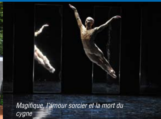
Magifique, l'amour sorcier et la mort du cygne