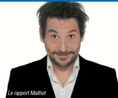
Le rapport Mailhot