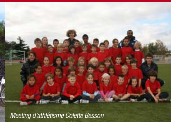
Meeting d'athlétisme Colette Besson