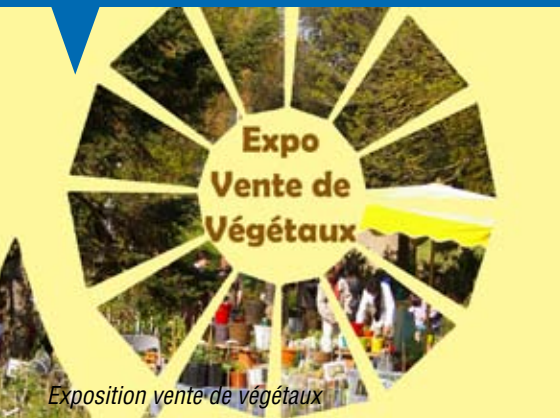
Exposition vente de végétaux