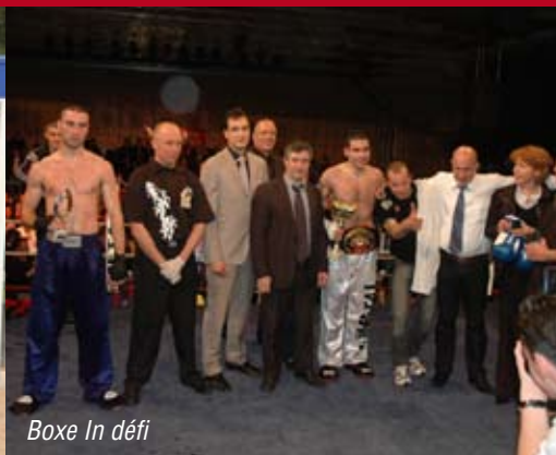
Boxe In défi