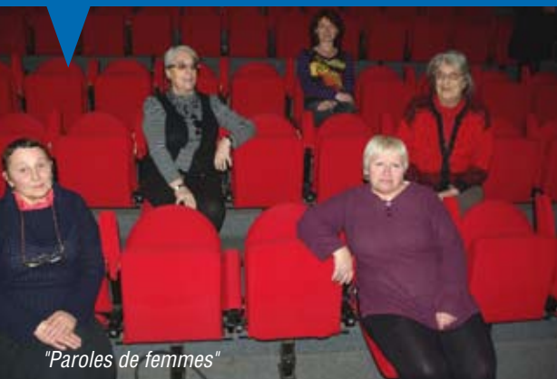
"Paroles de femmes"