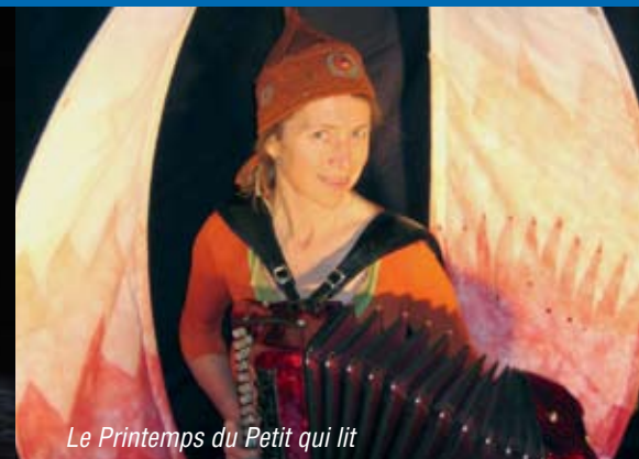
Le Printemps du Petit qui lit