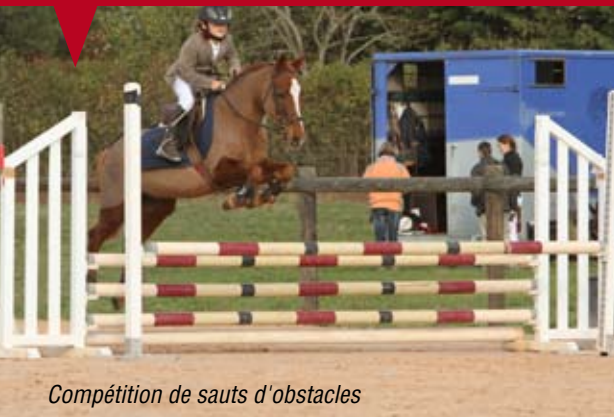
Compétition de sauts d'obstacles