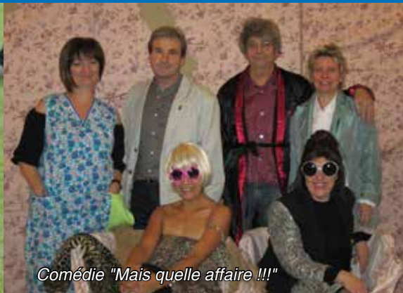
Comédie "Mais quelle affaire !!!"