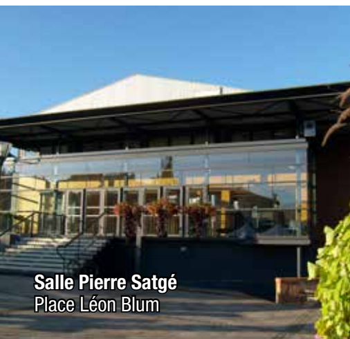
Salle Pierre Satgé Place Léon Blum