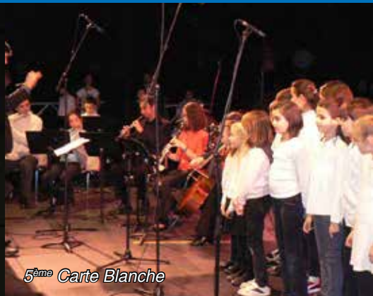
5 ème Carte Blanche

A 16h, au Théâtre Municipal Tarifs : enfant 5 €, 1 er adulte gratuit, adulte 5 € Billetterie : http://billetterie.mairie-muret.fr Renseignements au 05.61.51.91.59.