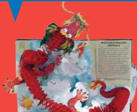
Lecture de livres animés