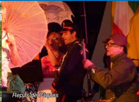
Repas de Pâques