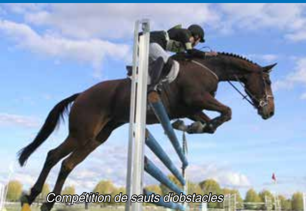
Compétition de sauts d'obstacles