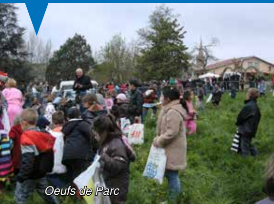
Œufs de Parc