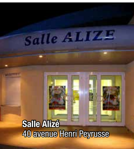
Salle Alizé 40 avenue Henri Peyrusse