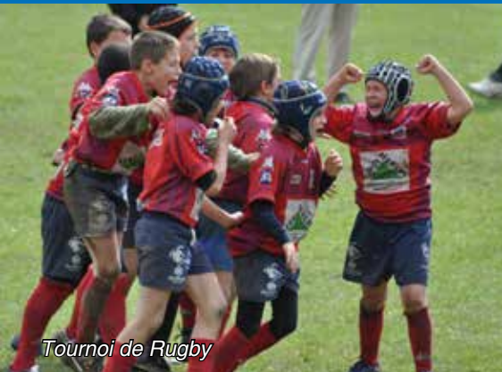
Tournoi de Rugby