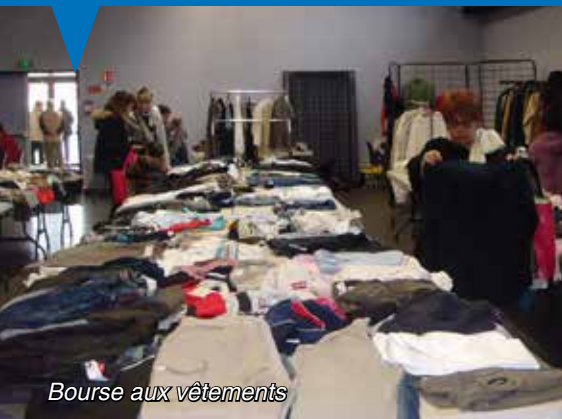
Bourse aux vêtements