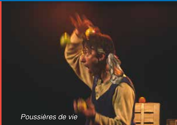
Poussières de vie