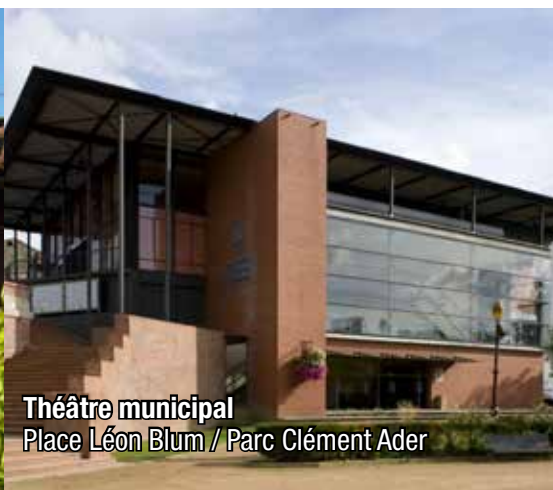
Théâtre municipal Place Léon Blum / Parc Clément Ader