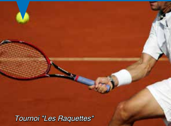
Tournoi "Les Raquettes"