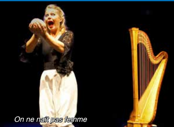
On ne naît pas femme