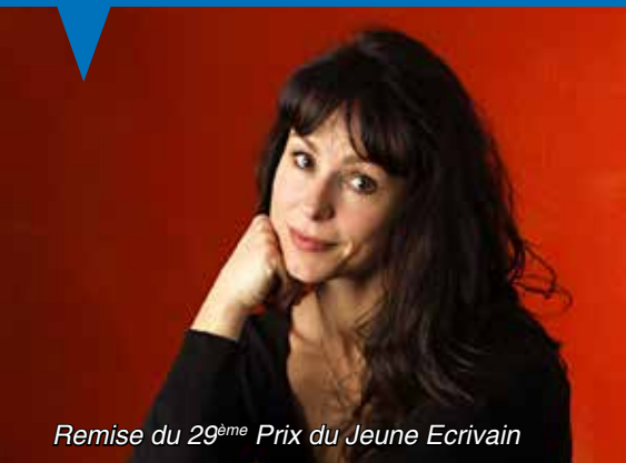
Remise du 29 ème Prix du Jeune Ecrivain