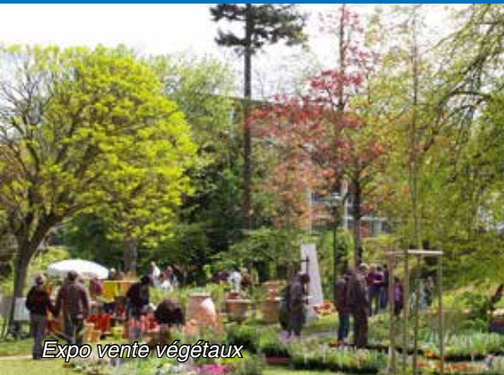
Expo vente végétaux