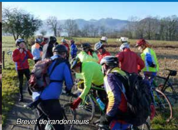
Brevet de randonneurs