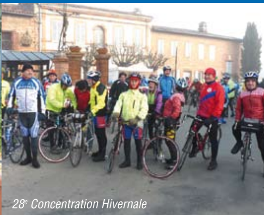
28° Concentration Hivernale