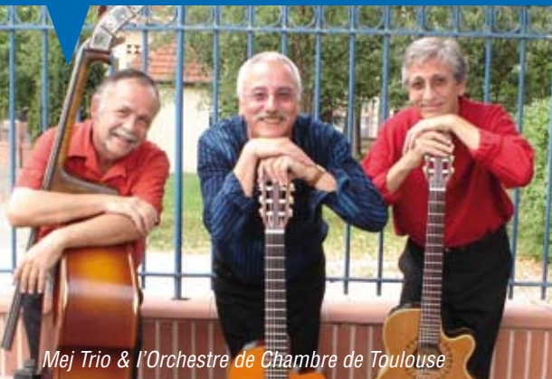
Mej Trio & l'Orchestre de Chambre de Toulouse