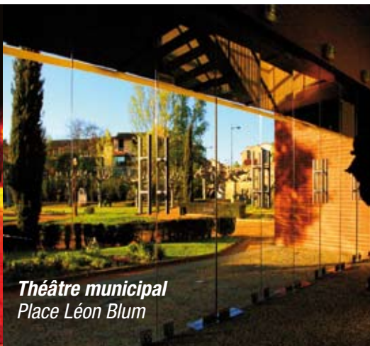
Théâtre municipal Place Léon Blum