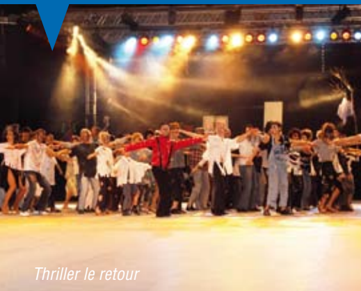
Thriller le retour