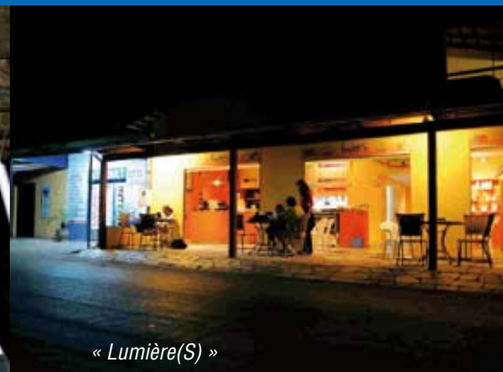
« Lumière(S) »