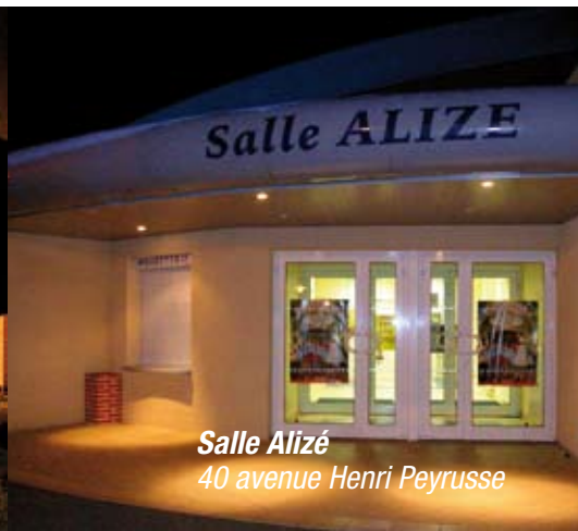
Salle Alizé 40 avenue Henri Peyrusse