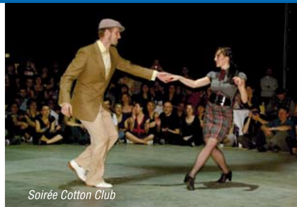
Soirée Cotton Club