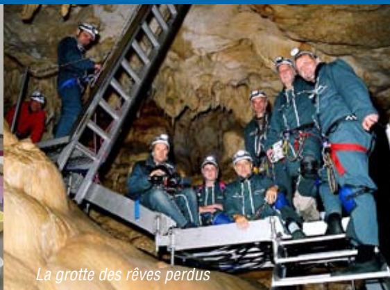
La grotte des rêves perdus