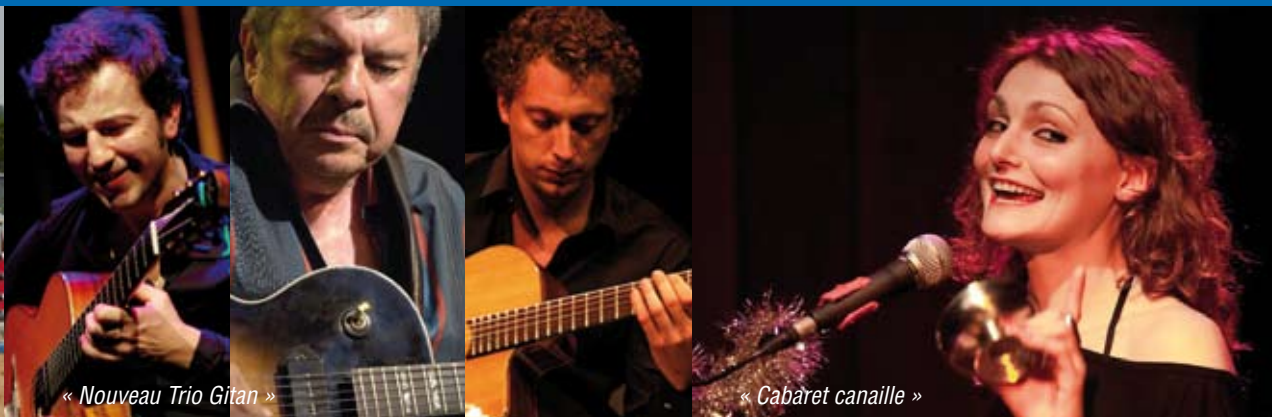
« Nouveau Trio Gitan »