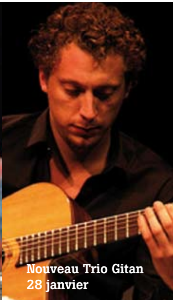
Nouveau Trio Gitan 28 janvier

Compétitions de sauts d'obstacles 29 janvier et 26 février