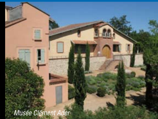
Musée Clément Ader