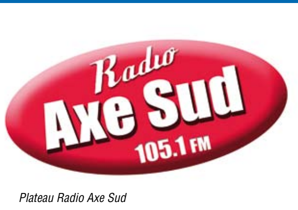
Plateau Radio Axe Sud