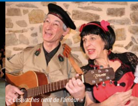
« Les vaches rient de l'amour »