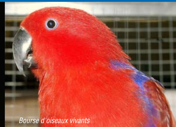
Bourse d'oiseaux vivants