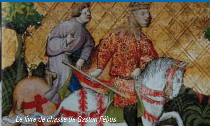
Le livre de chasse de Gaston Fébus