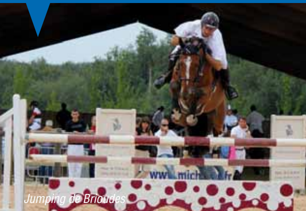
Jumping de Brioude