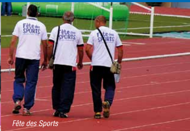
Fête des Sports