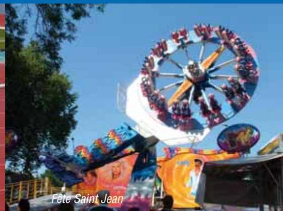
Fête Saint Jean