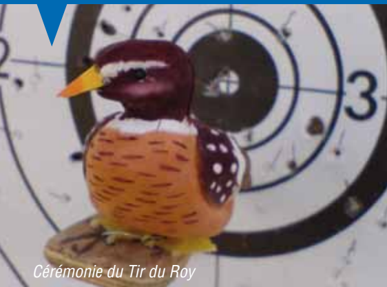
Cérémonie du Tir du Roy