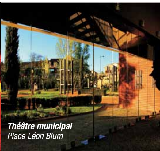
Théâtre municipal Place Léon Blum