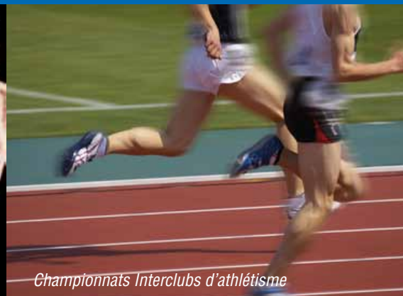
Championnats Interclubs d'athlétisme