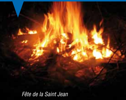
Fête de la Saint Jean