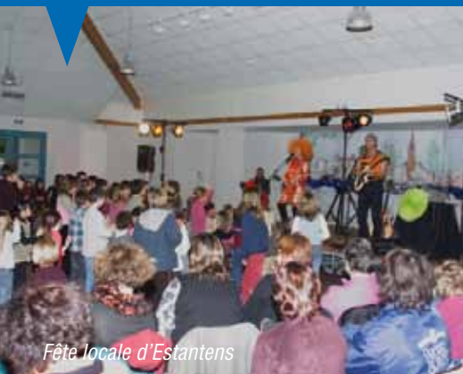
Fête locale d'Estantens