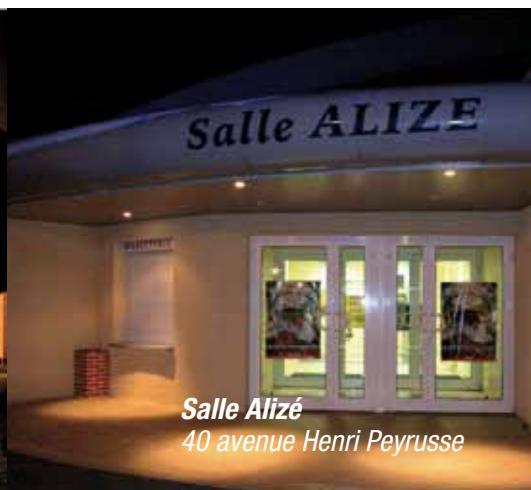
Salle Alizé 40 avenue Henri Peyrusse