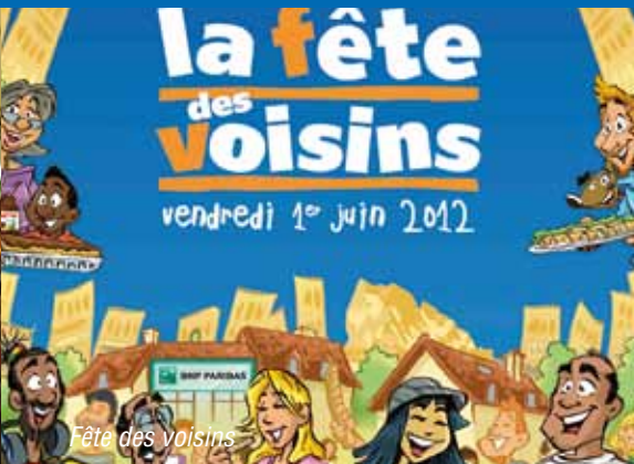
Fête des voisins