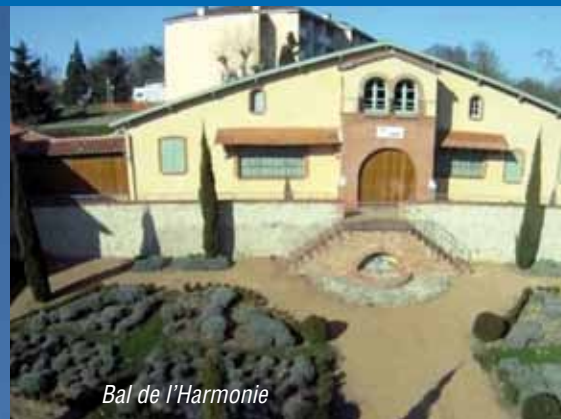
Bal de l'Harmonie