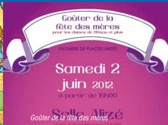
Goûter de la fête des mères