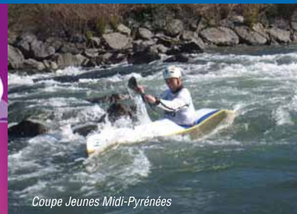
Coupe Jeunes Midi-Pyrénées

Départ à 9h30, de l'Office Municipal de Tourisme. Gratuit Inscription conseillée car places limitées. Pour tous renseignements et inscriptions aux activités des Journées Nature, contacter l'Office de Tourisme au 05.61.51.91.59