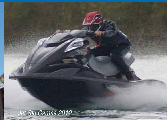
Jet Ski Games 2012