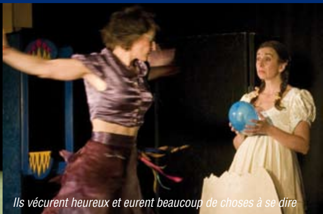
Ils vécurent heureux et eurent beaucoup de choses à se dire