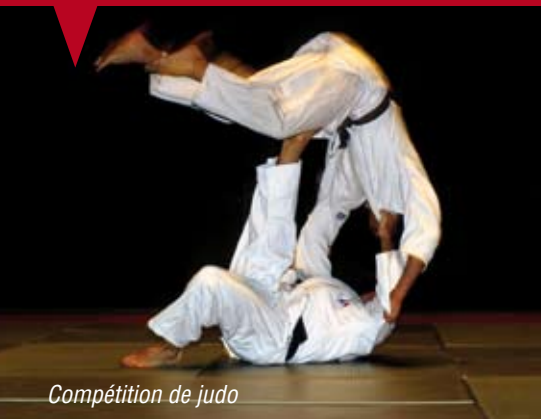
Compétition de judo