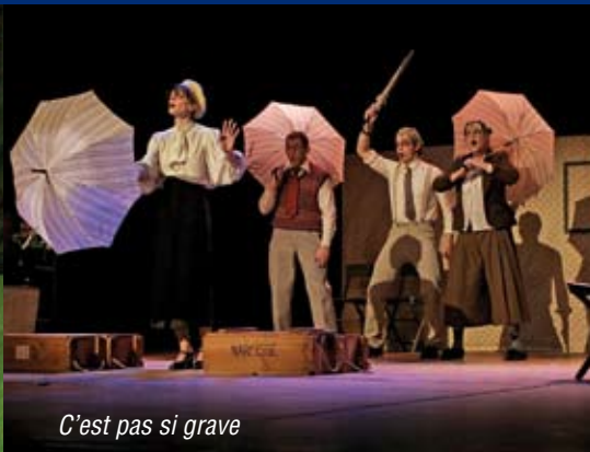
C'est pas si grave