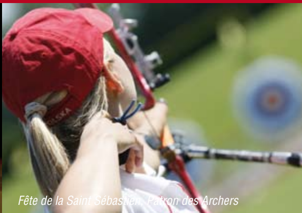
Fête de la Saint Sébastien, Patron des Archers