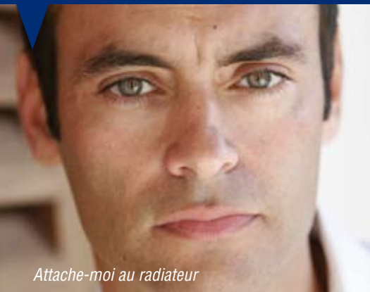
Attache-moi au radiateur