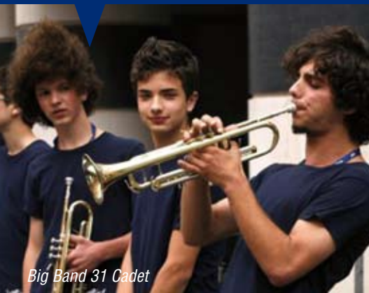
Big Band 31 Cadet