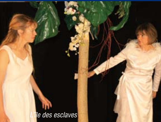
L'île des esclaves