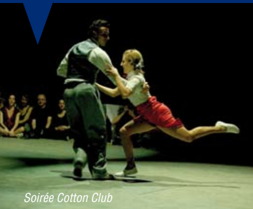
Soirée Cotton Club