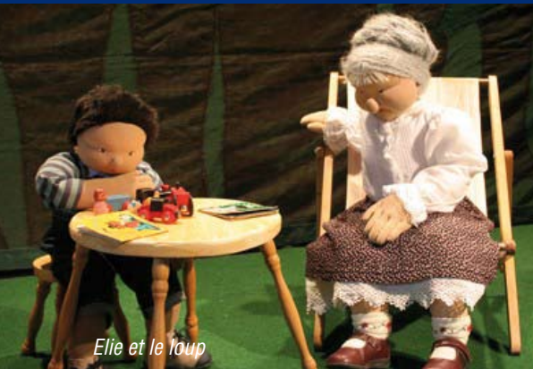
Elie et le loup